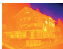
Imagen térmica sin testo ScaleAssist

Como la escala de temperatura y el esquema cromático de las imágenes térmicas pueden adaptarse de forma individual, es posible que el comportamiento térmico de un edificio se interprete erróneamente, por ejemplo. La función de testo ScaleAssist soluciona este problema adaptando la distribución cromática de la escala a la temperatura interna y externa del objeto a medir, así como a su diferencia. Esto permite obtener imágenes térmicas objetivamente comparables y correctas.