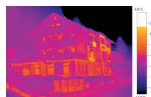
Imagen térmica con testo ScaleAssist