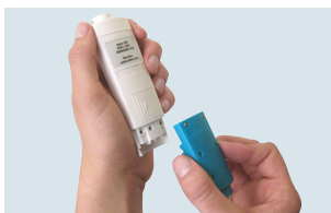
Cambio sencillo de sonda en los testo 206-pH1/-pH2/-pH3