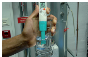
Ideal para comprobación de agua de calefacción conforme a VDI 2035.