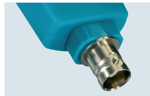
testo 206-pH3: sonda pH3 con conector BNC