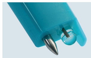
testo 206-pH1: sonda pH1 para líquidos